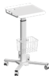
Передвижной стол с регулировкой высоты